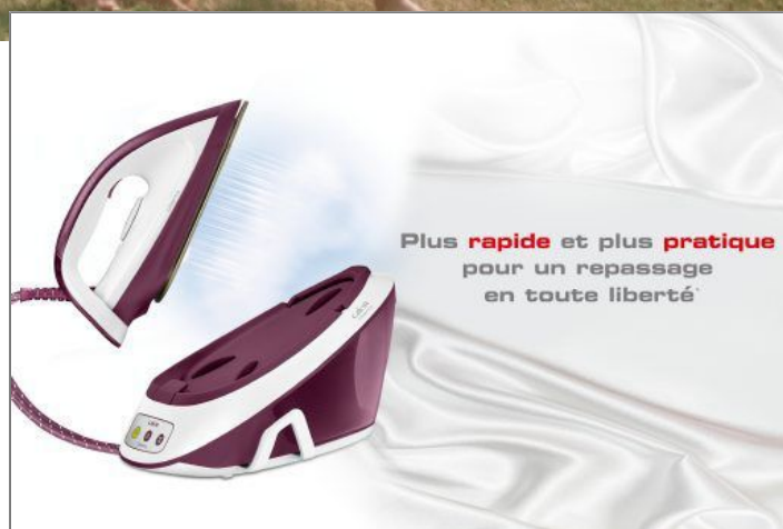
LIBERTY Centrale vapeur SV7010C0