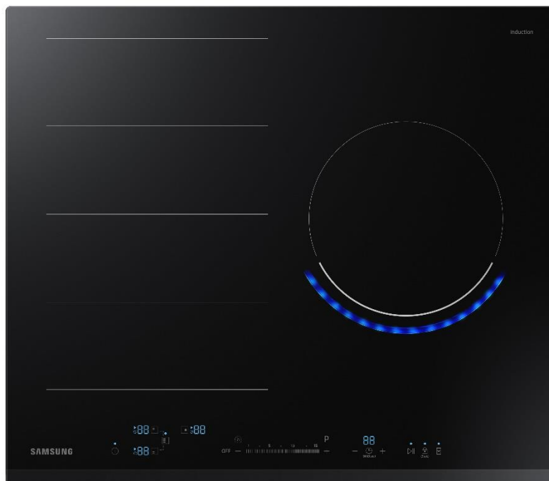
TABLE À INDUCTION 3 FOYERS - VIRTUAL FLAME™