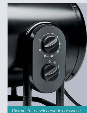
Thermostat et sélecteur de puissance