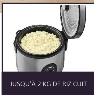
JUSQU'À 2 KG DE RIZ CUIT