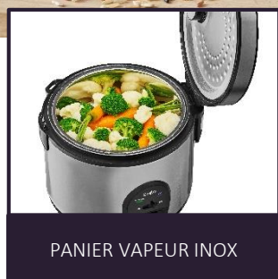
PANIER VAPEUR INOX