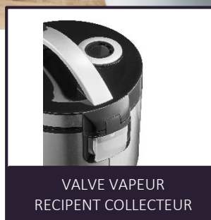
VALVE VAPEUR RECIPENT COLLECTEUR