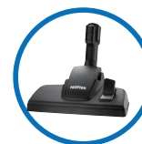
Brosse sols combinée 128389012