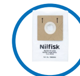
1 sac hygiène inclus