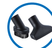
Brosse meuble et embout ventouse 107414330